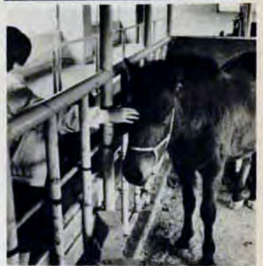
ようこそ「木曾馬、さん

このほど総合農事センターに、岐阜市から木曾馬（メス・2歳）が贈られてきました。北九州市のめん羊と交換したものです。 木曾馬は木曾地方に産する日本在来種で小型の馬です。暑さ寒さにも強く、おとなしくて力も強いので、昔から労働馬として、人々の生活に役立ってきましたが、いまでは、めっきり数が減っており、手厚く保護されています。