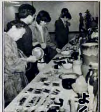
よくできりるわー

「この茶碗、いい色ねー」見て「これほしいわ」と来場のみなさん。11月13日〜18日、その7階で開かれた心身障害者作品展、雇用促進展はながなが好評で、期間中約五千人がやってきました。出品したのは、市内の児童・成人施設や学校、あゆみの会や三 十七団体。会場いっぱいには絵画、工作、手芸、印刷物、被服、盆栽などがズラリ。「ノコを使うのはこわかったけど切絵は楽しかった」など創作の感想が添えられた作品もあって来場者は思わずニコニコ。なかでも、展示即売コーナーに人気を集まり、ハンおきや花びんなどの陶器、袋物やセーター、エプロンなどが安さもあって次々に売れていました。