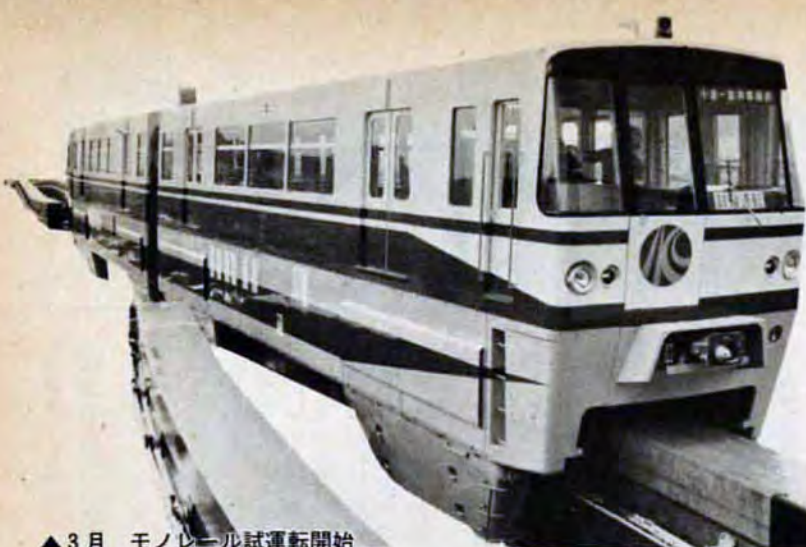
▲3月 モノレール試運転開始