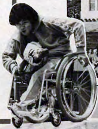
▲6月 「がんばれ」 身障者体育大会

今年2月10日、北九州市に待望の「市民憲章」ができました。これは、よりいっそうの市民参加によるまちづくりをめざすもので、みんなで守る五つの約束を定めました。 また、今年には「国際障害者年」、本市でも記念式典やパレードを初め、「ふれあいキャンプ」「日米車椅子バスケットボール大会」などのいろいろな行事が行われ、完全参加平等、こけりて大きな一歩を踏み出しました。 二年目にあたる「新・新中期計画」も順調に進みました。都市モノレールの試運転が開始（3月）、また八幡駅ビルには自然史博物館がオープン（5月）して、訪れる市民を楽させています。 このほか、友好都市の中国・大連市において、北九州工業展が開かれ（10月）大好評を博すなど、実りある一年でした。