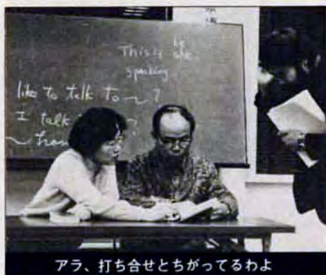
アラ、打ち合せとちがってるわよ

How are you? (ああ、皆さん、ごきげんいかがですか。えっ、市政だより、もどろろ英語版が出たかって、その早合点されちゃ困ります。実は、一枝公民館の「やさしい英会話」講座におじゃましてみました。