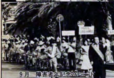
9月 障害者年記念パレード