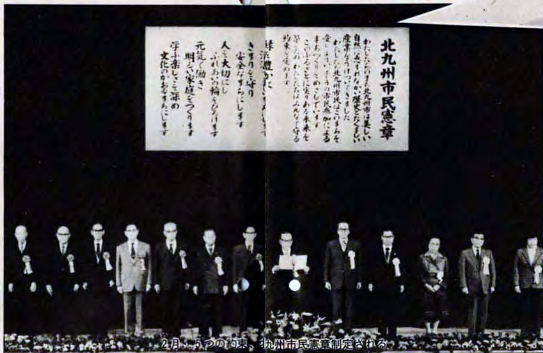
2月 5つの約束、北九州市民憲章制定される