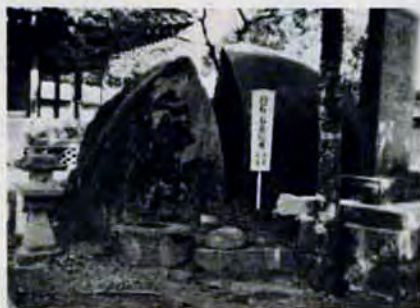
小倉南区貫の庄八幡神社境内にあります

火災は恐らく陸石であったらと思います。「鈴石」の信仰が「夫婦円満」というところからも。