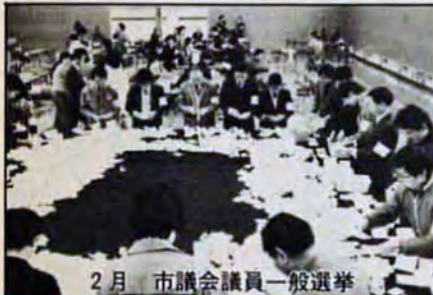
2月 市議会議員一般選挙

今年2月10日、北九州市に待望の「市民憲章」ができました。これは、よりいっそうの市民参加によるまちづくりをめざすもので、みんなで守る五つの約束を定めました。 また、今年には「国際障害者年」、本市でも記念式典やパレードを初め、「ふれあいキャンプ」「日米車椅子バスケットボール大会」などのいろいろな行事が行われ、完全参加平等、こけりて大きな一歩を踏み出しました。 二年目にあたる「新・新中期計画」も順調に進みました。都市モノレールの試運転が開始（3月）、また八幡駅ビルには自然史博物館がオープン（5月）して、訪れる市民を楽させています。 このほか、友好都市の中国・大連市において、北九州工業展が開かれ（10月）大好評を博すなど、実りある一年でした。