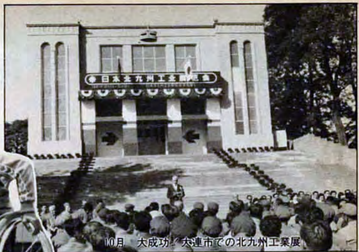
10月 大成功 大連市での北九州工業展