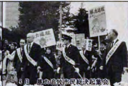
3月 県功進放市民総決起集会