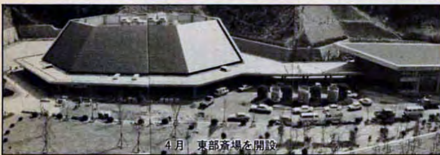
4月 東部斎場を開設