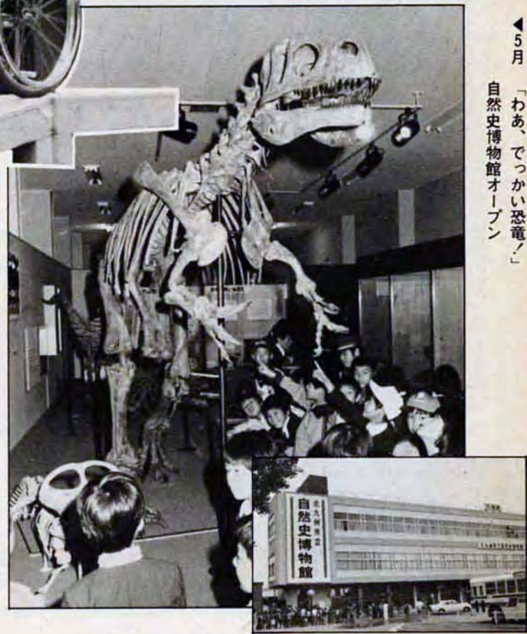
▲5月 「わあ、でっかい恐竜」 自然史博物館オープン