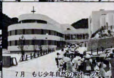
7月 もじ少年自然の家オープン