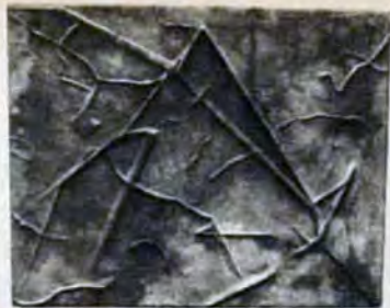
大賞作品「空間の記憶」

復元工事を進めていた森鷗外旧居が完成。市民のみなさんに公開します。無料。 ところ…小倉北区鍛冶町一丁目7-2 開館日…▶ 3月26日は開館式のため午前11時～午後3時 ▶ 3月27日から毎日午前9時30分～午後4時30分(休館は月曜・祝日・年末年始。月曜が祝日の時は翌日も) この家は、森鷗外が陸軍第12師団軍医部長として小倉に勤務した約3年間(明治32年6月～35年3月)の前半を過ごした家で、東京に帰ってから書いた短編「鷗」は、この家を舞台にしたもの。また、明治31年頃に建てられたこの家は、六間取りの町屋で、史跡としてだけでなく、明治中・後期の建築様式を残すものとして貴重です。