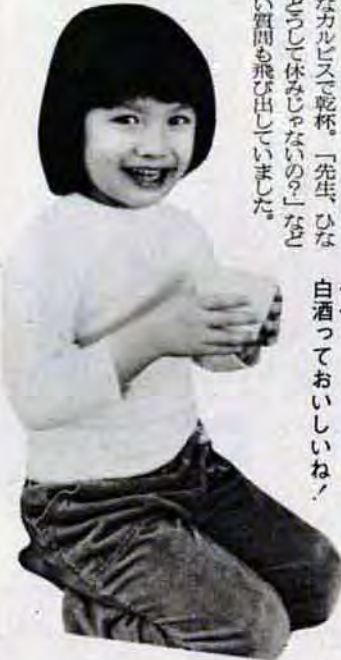
白酒っておいしいね!

この日は、白酒のかわりにちびっ子の大好きなカリスで乾杯。「先生、ひな祭りはどうして休みじゃないの?」などかわいい質問も飛び出していました。