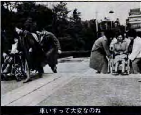
車いすって大変なのね

「車いすのキャップハンディを体験して、障害者の方の苦勞が、本当によくわかりました。「盲眼は一見に如かず」と言いますが、「盲眼は一指に如かず」ですね——戸畑中央公民館の、婦人ボランティア講座は、2月19日閉講しましたが、約三十人の参加者は、それぞれに充実した日々を振り返ります。「ボランティアってむずかしそう、堅苦しいと