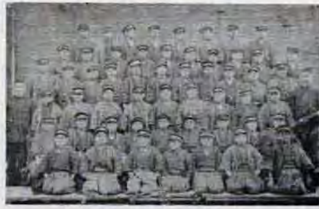
直方高等学校の卒業写真