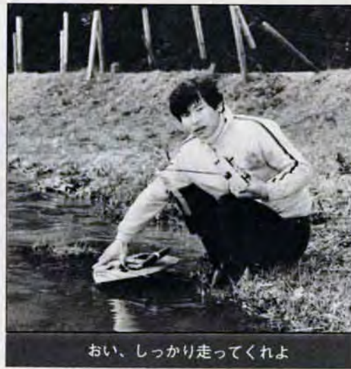
おい、しっかり走ってくれよ

なって言えないんですよ、自分の部屋がこのままですからね」と苦笑い。奥さんももう半ばあきらめたという表情で、「よくやりますよ、ええ……」とひとこと。 自分の手で作ったものを自由自在に動かせるのが最大の魅力だが、初めて動かす時にはいつも不安がつきまとう。「ほら、プロ野球の選手がよく言うように、何年やっても、開幕戦では、『今年は大いじょうぶだろうか』って、あれと全く同じ心境ですよ」。