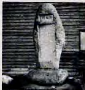
明治9年に建てられた千拓記念碑(下吉田)

上げよ」と命じました。待ちかまえていた工事人たちは、それとばかり、大石をドン・ドン積み上げていきました。こうして、さしもの難工事も完成することができました。