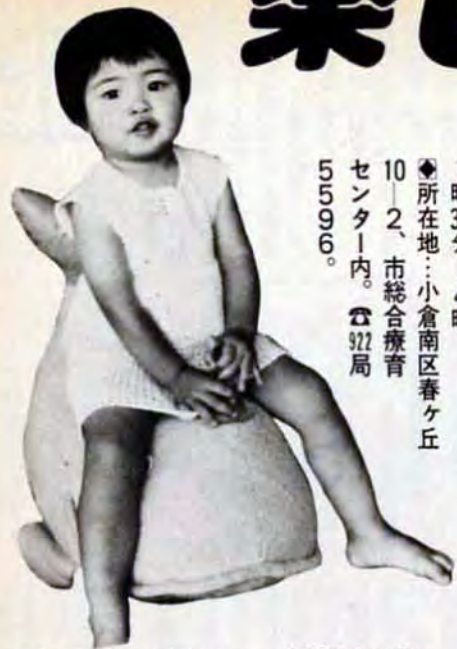
▲ラクチン、ラクチン——麻布のクジラ

★ホク、「おもちゃライブラリー」にいるクジラ。ここには、布の絵本ちゃんやワイクペンチくんなど楽しい仲間たちがいっぱいいるんだよ。 ホクたちの仕事は、障害をもつ子どもたちと一緒に楽しく遊ぶことなんだ。ホクたちは、障害の種類や程度等に応じて作られているから、きつと役に立つと思うんだ。楽しいこと受けあひだよ。 みんなで一度遊びにきてみて! ◆「おもちゃライブラリー」は、おもちゃ遊びを通じて障害児の心身の機能回復を行う施設です。 ◆障害の種類や程度に応じて、①おもちゃの貸出し・紹介 ②おもちゃの正しい与え方や作り方、相談...などを行っています。お気軽にご利用を。無料。 ◆利用できる人: ①心身障害児とその家族 ②保育所、幼稚園等の職員 ③ボランティア。 ◆開館日: 毎月第2・第4土曜日午後1時30分～4時。 ◆所在地: 小倉南区春ヶ丘10-2、市総合療育センター内。☎922局5596。