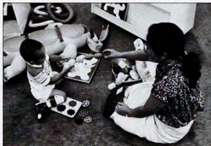
▲そっちを引っ張って、お母さん——楽しいプッチンピーズ