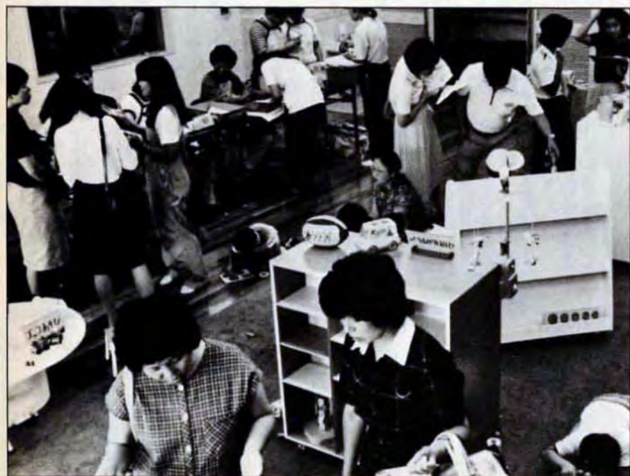
▲開館日はいつも大勢の利用者でいっぱい