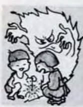
後始末をしっかりと!

子どもの花火遊び等火の元には十分気をつけてください。市は、タンク車を主体に、防火体制を強化して万が一に備えています。