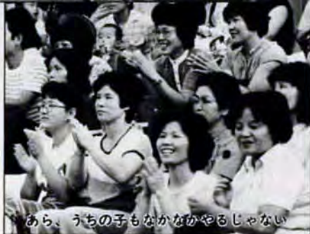
あら、うちの子もなかなかやるじゃない

「どうだい。ボクの変身きまつてるだろう」 7月3日、藤松小学校で第一回の「藤松っ子祭り」が行われ、全校児童と家族約千二百人が参加しました。 七夕の飾りを周りに立てたグラウンドでは、学年ごとに仮装行列や笛の演奏を披露。特に6年生による歴史絵巻には、卓抜なアイデアに感心する声があふいた。 ファイナレは、手作りの灯ろうに火を入れ、合