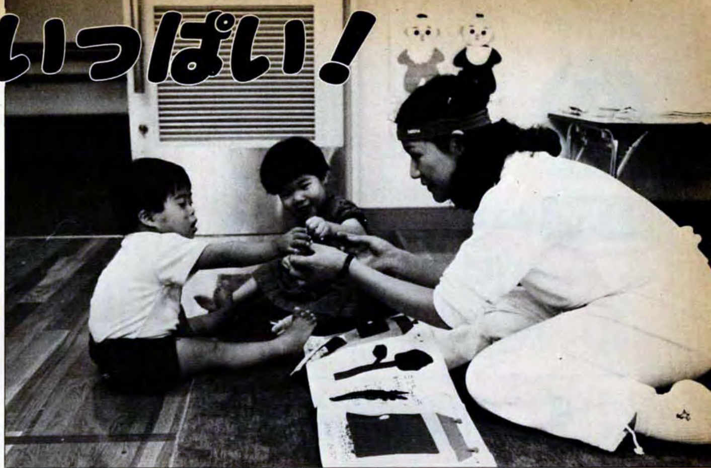
▲おねえちゃん、これどこにつけるの?——大人気の布の絵本