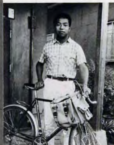
この愛車は4台目。分解整備も楽しみのひとつという。

中学2年の時、知り合いに自転車の好きな人がいて、その影響でサイクリングを始めました。高校時代は一泊コース程度を走っていたが、本格化したのは九州工業大学に入って、サイクリング部に籍を置いてからです。 「自転車はとにかく自由がきくのです。予定のコースを走りながら、フト、気が変われば、左右前後とこんな細い田舎道でも入って行けます。走り疲れて休んだところで思わぬ風物や人との出会いがあったりするんです。人生の縮図的なものがありますね。」 昨夏は、大学サイクリング部で一か月かけて北海道を巡った。今春は九州中央部を鹿児島まで縦断。今夏の合宿では東北地方をひた走り、その後一人で北海道へ渡る予定だという。ひまさえあれば走りまくるのである。 「日本縦断が目標の一つで