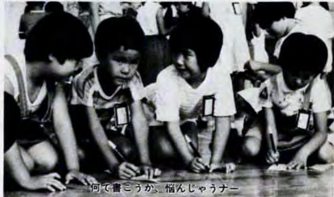
何て書こうか、悩んじゃうナー