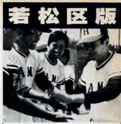
「やったぜ、ホームラン」——7月4日、若松運動場で行われた壮年ソフトボール大会で、浜町が優勝。2位東25区と共に秋の市民体育祭の出場権を獲得しました。