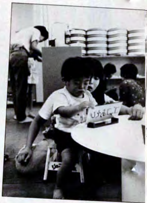
▲あらあら、それはおもちゃじゃないのよ