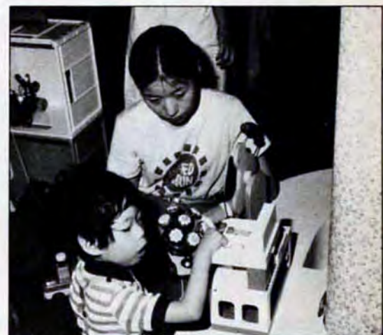
▲あれ? これいいのかな