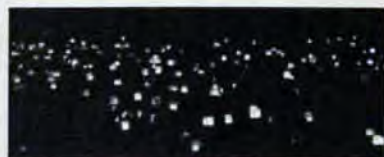
闇の中に灯ろうが浮かびあがる