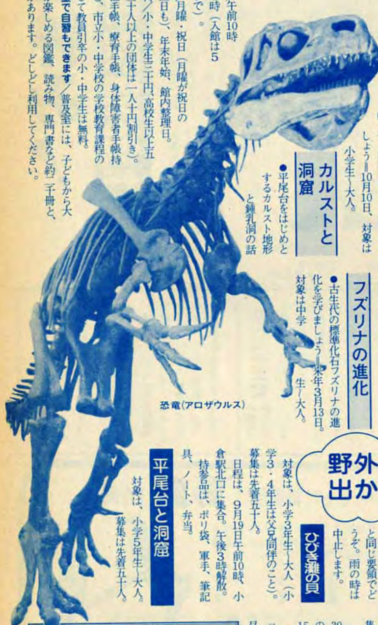
恐竜(アロザウルス)