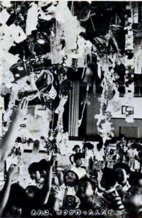
あれは、ボクが作ったんだぞ