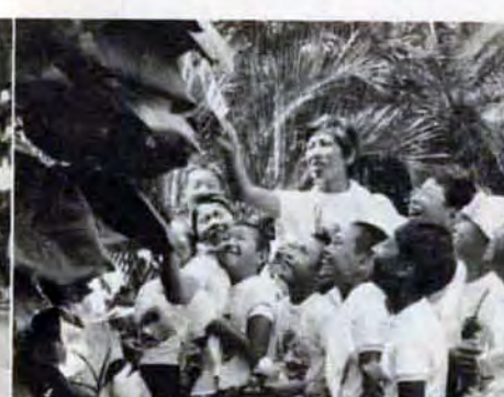
「でっかい葉だなア」東南植物園で