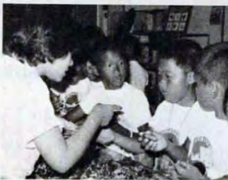
最大の楽しみはやはりショッピング