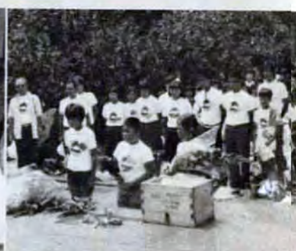
摩文仁の丘で福岡県慰霊碑に参拝