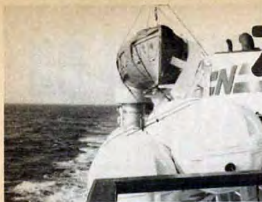
大海原を進む少年の船「ユートピア号」