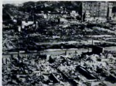
八幡大空襲で一面の焼野原となった中央町。

ったんやが、戦争中、軍の命令で買上げられてね。それで大空襲のときは、この岡田町に住んごったんやが、皮肉なことにもとの家は焼けて、こっちの方が、いの一に焼けてしもった。あたしは、警防団長なんで帰るわけにもいかず、何もかも焼けて……の通りの、昔の写真一枚すらないよ。そうそう、焼けた家の横に不発弾がめりこんでましたな。