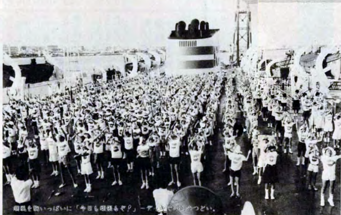
御旗を掲げっぱりに「今年も頑張るぞ」—デモキベの朝やつどい