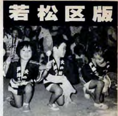
会場いっぱい防火の輪

「楽しみながら防火・防災」——8月3日、古前小学校で約1,300人が参加して「市民と消防の夕べ」が行われました。 消防音楽隊の演奏の後、古前保育所のチビッコがそろいのハッピーで「仲良し盆踊り」や「忍者ハットリくん」を元気に披露——「小さなハッピーでかわいいわね」と会場のお母さんたちは大きな拍手。 地区対抗バケツリレーや消防今昔、盆おどりなど、会場いっぱい防火の輪をつくり、夏の夜を楽しみました。