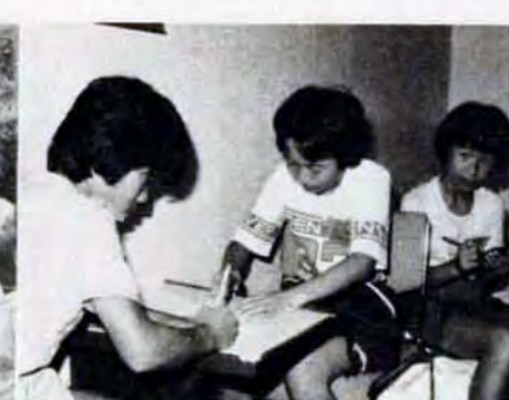
船から両親へ手紙を書きました