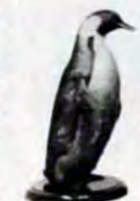
コウテイペンギン

八幡東区西本町三丁目6-1 国鉄八幡駅ビル内 69局7308 ☎805 毎月曜は休館 入場料は大人五十円、子供三十円 特別展「野鳥」 9月12日まで 自然史博物館分室(八幡東区尾倉三丁目、旧水道局庁舎)で、北九州で見かける鳥や珍しい鳥のはく製標本約五百点を展示。なお、8月21日午後1時30分から特別講座「パトリオット」を開催 植物相談コーナー 8月22日午前10時~午後4時30分、自然史博物館分室(八幡東区尾倉三丁目、旧水道局庁舎)で