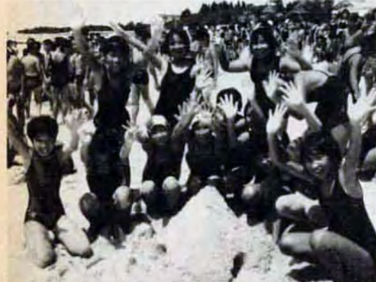
「砂の芸術品ですよ ワーイ」 海洋博記念公園で海水浴