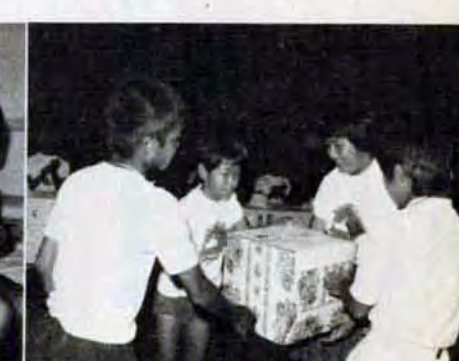
本部町の歓迎会で記念品を交換