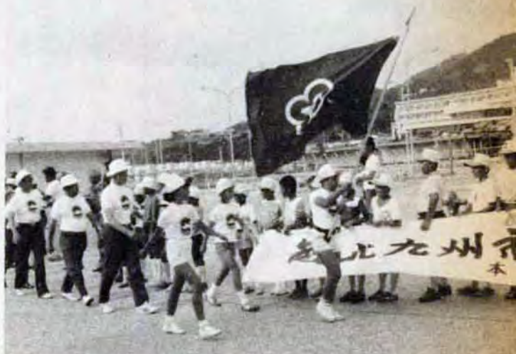
「沖縄のみなさんこんにちは」市旗を先頭に本部港に第一歩