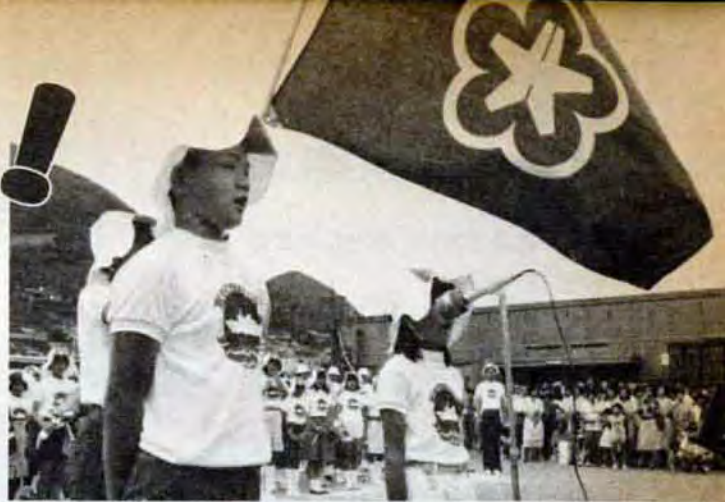
出航式で力いっぱい決意をのべる団員代表