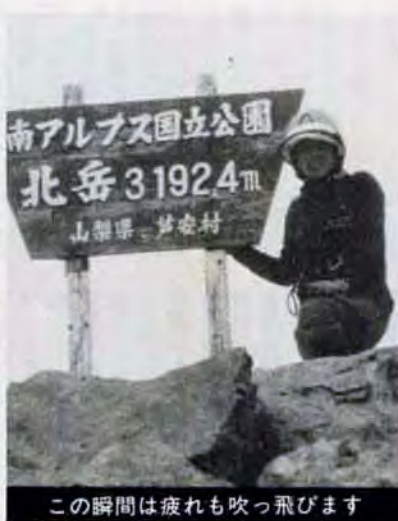
この瞬間は疲れも吹っ飛びます

ほどしかありませんでした。血倉山の国見岩で練習を積み、まず鹿島権ヶ岳(長野県)に挑戦。「下をちよつとぞいでみたけど、ひびがガクガクなんてことはなかったわ。むしろリーダーの方が、ひやひやしてたんじゃなかいか」とはさすがにいい度胸、