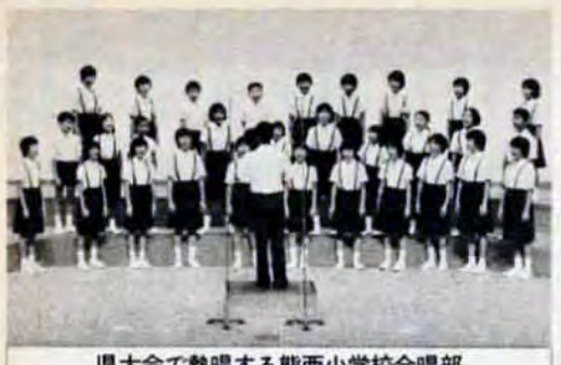
県大会で熱唱する熊西小学校合唱部