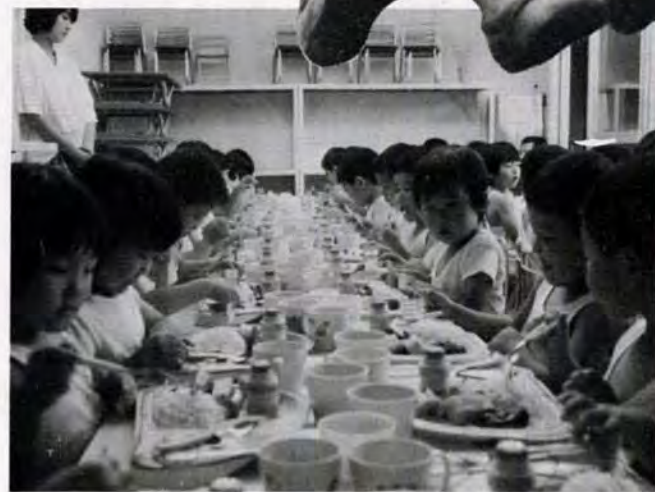
おなかペコペコ。先生、早く食べようよ