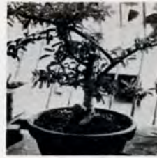
元根のたか根... 置さる... かん見... ラララよ... ベビを

めに日記をつけること。「ポケ」の予防ですよ、ハハハ。そして、もう一つは、体力維持のために毎朝ラジオ体操をする(一)。