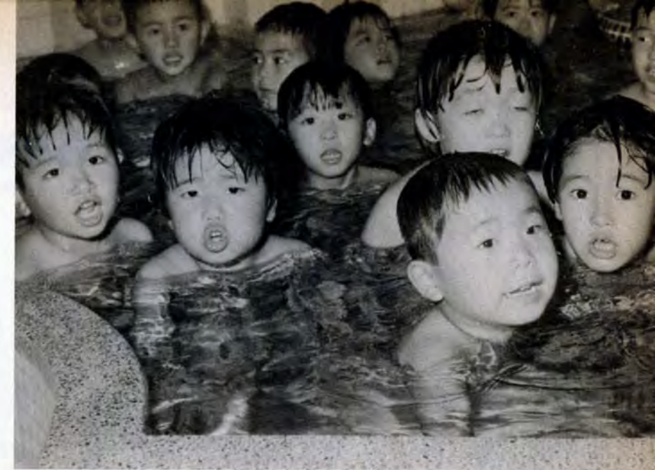
わー広いな。プールみたい

〔利用〕 保育所・幼稚園単位で、年度初めに抽選会を開きます。問合せは、おひさまのいえ(若松区大字竹並、741局0468)へ。