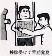
検診受けて早期発見

子宮がん検診 ★対象は、区内の女性。料金は千円。ただし、次の人は無料です。①65歳以上の(健康保険証など年齢のわかるものを自参のこと) ②生活保護世帯の人(福祉事務所受診券をもち) ③市民税非課税世帯の人(受診する7日前までに門司保健所321局4586へ連絡を)。