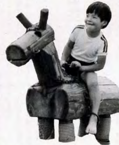
カッコいいだろ。ボク、カウボーイ