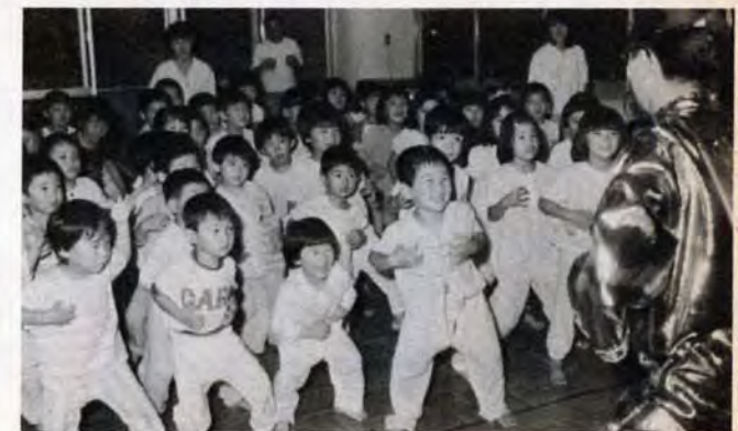
トンダーマン退治の踊りだよ