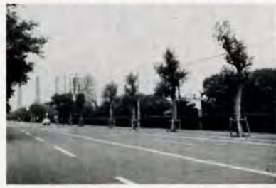
今は、工場が建ち並ぶ皇后崎にも、魚やエビがたくさんあった。