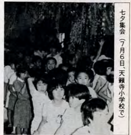
七夕集会 (7月6日、天籟寺小学校で)