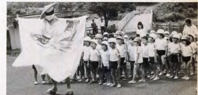
あっ、トンダーマンだ!