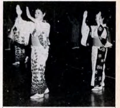
7月4日、若松体育館で行われた「民謡の夕べ」。