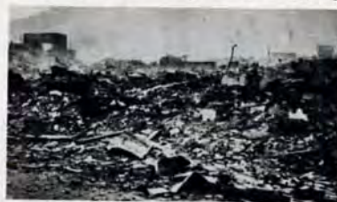
昭和20年8月8日の大空襲で、八幡は一瞬のうちに焼け野原に

昭和20年8月8日は、青く暗れたった熱い日だった。会社(安川電機)の屋上から高射砲の煙が見えまじった。「演習をしようぜ」と、思ったのもつかの間。まだ昼になりはじめていた。ゴーというB29の恐ろしい響き。そのころ、私の家は桃園町(現・八幡東区)にあったんです。「あつゝ家の方がやられよる」。家には所帯を持っていたばかりで、女房が独りきり。おなかには子供が。私は、わが家目指して飛び出し、結婚して一年半のわが家は、見るも無残につぶされたりしました。しかし、女房の姿がどこにも見えない。どこに行ったの。