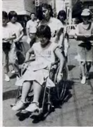
車いすで大変なねー高校生のために開かれたボランティア講座。8月4日は実際に車いすに乗って町に出かけてみました。