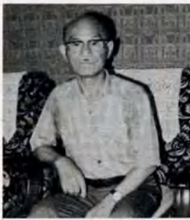
小倉がある限り続けます

「準備期間はどのくらい?」 「当日は昼から登りますが、四、五日前から草刈り、灯油や竹の調達、手伝い人の手配をします。」 「昔は、名もない一峰に「小文字山」と名が付き、小文字通り、小文字町と、地元の名刺になりました。北九州・小倉がある限り、この行事だけは、やめられんです。」