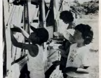
ボクたちが大好きなんだ—自動車文庫に集まる子供たち。 (写真は8月6日、貫緑町で)