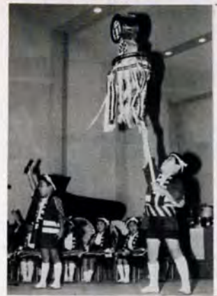
火の用心ノ——8月2日、若松市民会館で行われた市民と消防の夕べの一コマ。