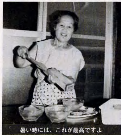
暑い時には、これが最高ですよ

「よかったですら、ごちそうして下さいよ」って、毎日だれかが訪ねてくるんです。「おいしい、おいしい」とほおばってくれる姿を見るのが楽しみです。」