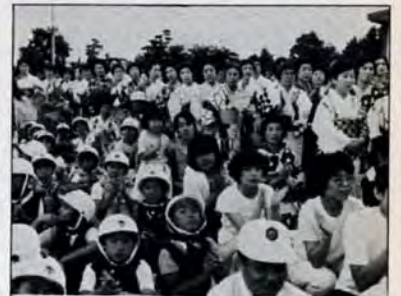
大盛況の消防の夕べ—8月5日、上津役小学校で行われた「市民と消防の夕べ」。うちわ片手に2000人。楽しい夏の夕べを過ごしました。