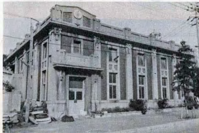
昭和60年度 北九州市指定文化財

市は、2月1日、有形文化財建造物として、「旧百三十銀行八幡支店」二棟を、昭和60年度北九州市指定文化財に指定しました。60年度市指定文化財については、昨年8月、市文化財保護審議会に諮問、今年1月17日、同審議会から答申を受けて、2月1日に指定したものです。これ、市内にある指定文化財は、市指定四十六件、県指定四十三件、国指定五件の計九十四件となります。