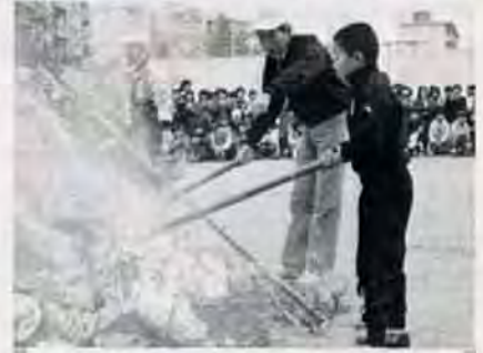
よく、燃やすだぞ——1月18日、赤崎小学校で、どんど焼きが行われました。