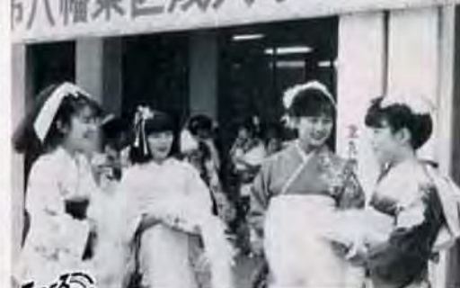
大人への出発—1月15日、八幡市民会館で八幡東区成人祭が行われました。「わあ、久しぶりね」「きれいになったじゃない」と振り袖姿の娘さん。真新しい大人の笑顔が輝いていました。八幡東区役所 ☎671局0801

★対象は、栄養教室終了後、地域で食生活改善活動をしていただける人。先着二十五人。テキスト代千円材料代実費。 【日程】 4月から一年間。毎月第一、三火曜日午前10時～午後0時30分。八幡東保健所。二回申込みは、2月2日から八幡東保健所7局0801内線310へ。