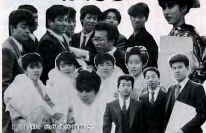
1月15日、駒馬池体育館で。