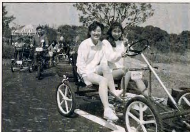
おもしろサイクルランドが響灘緑地にオープン(3月20日) — コースは1周250m。寝そべて運動するものやパラルル付き、4人乗りなどの風変わりな自転車が勢ぞろい。日曜日、祝日、学校の春・夏・冬休みに、30分間300円で貸し出します。