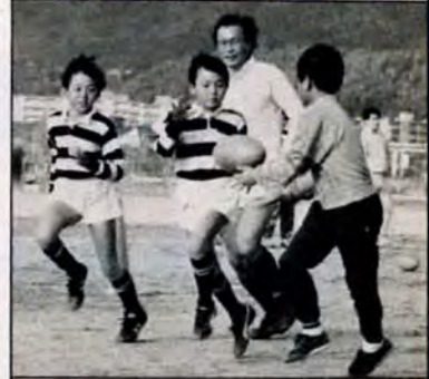
ナイスパス——毎週土曜日の午後、洞北公園グラウンドでラグビーボールを追いかける子どもたち。未来の名ラグーを目指して、ファイト!!