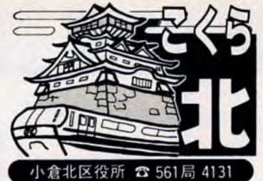
小倉北区役所 ☎ 561局 4131

小倉北柔剣道場 田町14-19 592局5209へ。受け付けは午後5時30分〜8時30分。 板櫃公民館の講座生を募集 対象は、市内に住むか勤める人。先着各二十五人〜三十人。受講無料(材料代実費)。各十回。時間は、いずれも午前10時〜正午。板櫃公民館(井堀二丁目)で。 ▼板櫃婦人学級 5月13日〜7月15日の毎週金曜日。▼家庭園芸教室 4月12日〜6月21日の毎週火曜日。▼刺しゅう教室 4月19日〜7月5日の毎週火曜日。 申し込みは、4月1日から板櫃公民館57局8750へ。