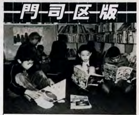
おとぎの国へご案内図書館には夢がいっぱい。子供たちの目は、生き生きキラキラ。(写真は、3月23日、大里こどもと母のとしょかんで)