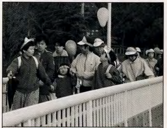
見慣れたまちにも新しい発見—3月21日、市内3コースで「あるきng25in北九州」が行われました。小倉城コースには家族連れなど約3000人が参加。途中降り出した雨にも負けず、9.7kmの歩きを楽しみました。

4月の無料相談 問い合わせは、小倉北区役所市民相談室57局0039へ。 年金相談 時間は、いずれも午前10時〜午後4時。▼毎週木曜日。市役所一階広聴課。▼1日:8日。15日:22日:27日。小倉北区役所国保年金課ホールで。 不動産相談 2日午前10時〜午後5時。井筒屋小倉店別館六階で。問い合わせは、日本不動産鑑定協会北九州分会57局7216へ。 法律人権特別相談 4日午後1時