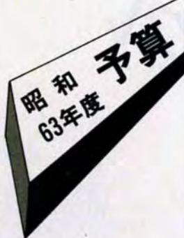
予算総額と前年度比較 (単位:千円)