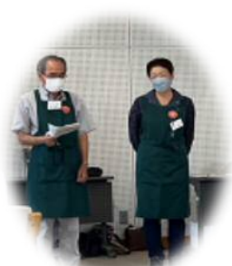
カフェマスターが お待ちしております