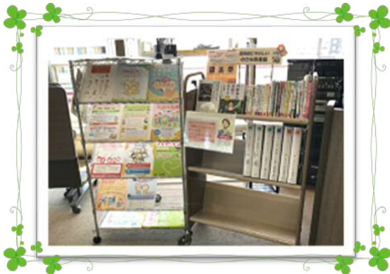
情報コーナー・認知症にやさしい 小さな本棚を設置しています